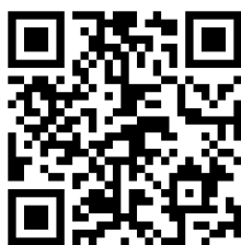
未滿 15 歲保險表單 QR code

未滿 15 歲保險表單 https://forms.gle/RYW4kvNkegvH3W2W8