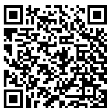
線上報名 QR code

線上報名連結 https://forms.gle/otsR3uwnUDT88dr3A