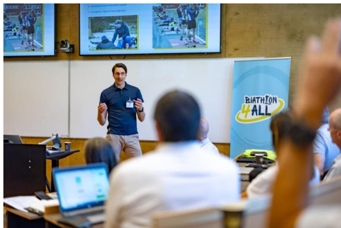
瑞典協會分享該國在 B4A 招募和培養年輕運動員