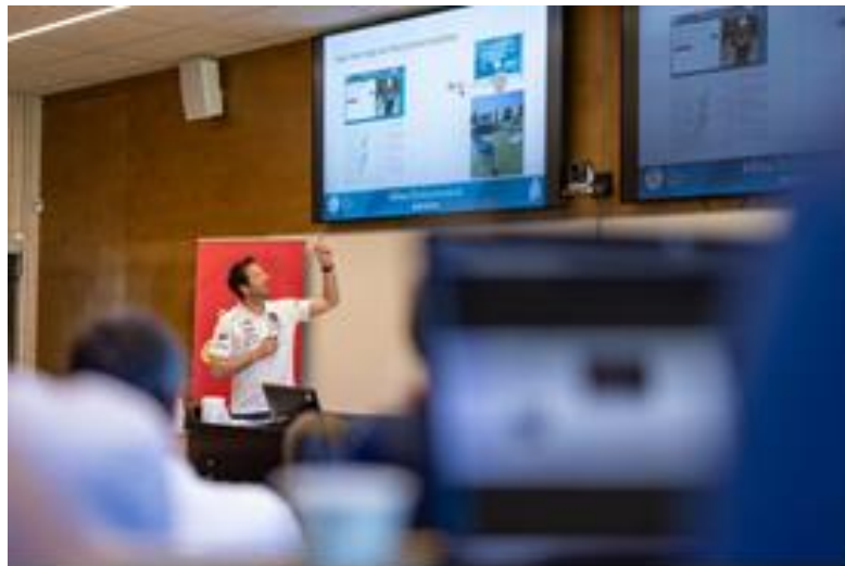
挪威協會分享該國在 B4A 招募和培養年輕運動員