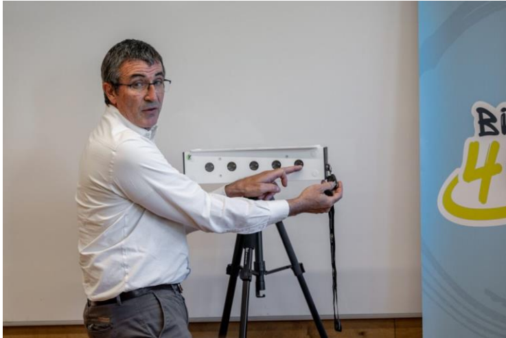
Kiwi Precision 裝置介紹