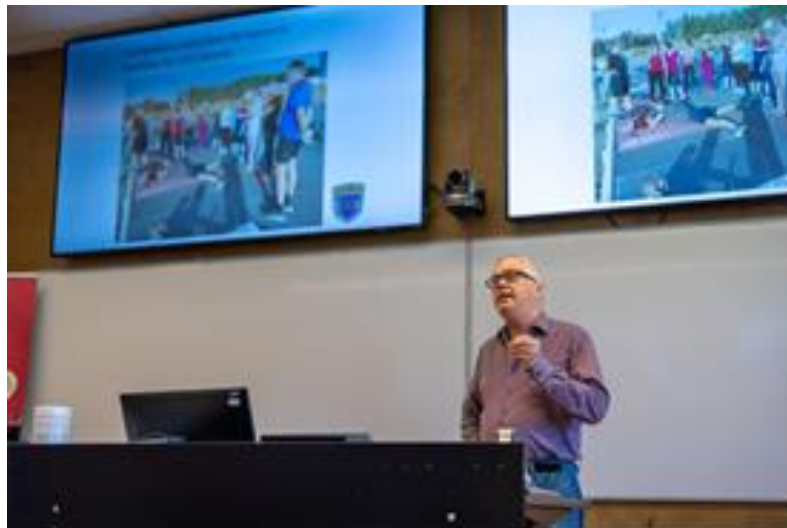
厄斯特松德冬季兩項俱樂部創辦人分享俱樂部發展歷程及重要性